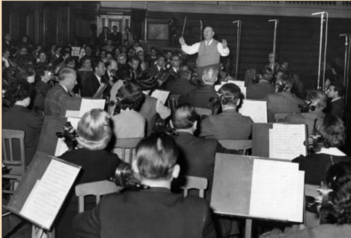
Répétition à la Sorbonne sous la direction de Pablo CASALS